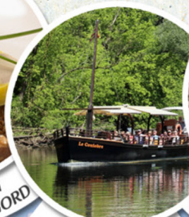
BALADE SUR L'EAU GABARRES DE BEYNAC