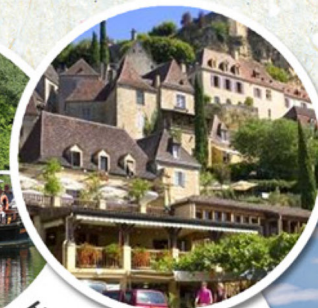
REPAS HOSTELLERIE MALEVILLE