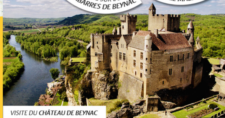
VISITE DU CHÂTEAU DE BEYNAC